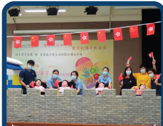
烈士紀念日-緬懷先烈的功績、向人民英雄致敬。