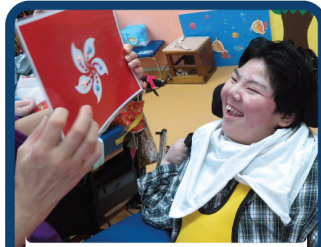
開心投入認識香港區旗的活動。