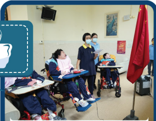
每周一進行升旗儀式響應國家安全教育。