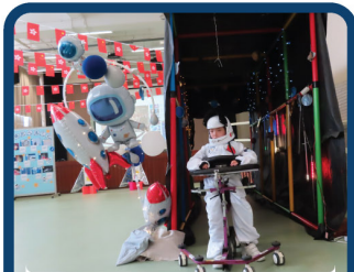
太空人有重大任務啊！