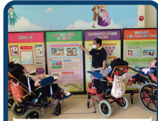
國家安全教育展覽，認識我的祖國。