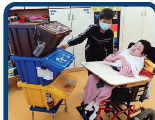
藉由資源回收認識生態安全的重要性。