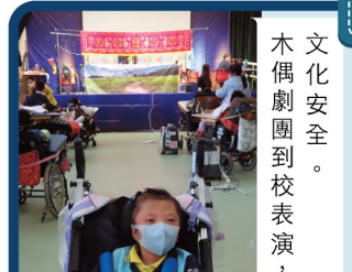
文化安全。 木偶劇團到校表演，了解