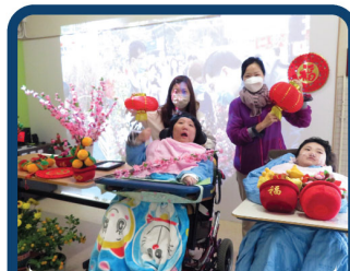
透過年宵活動認識中華文化。