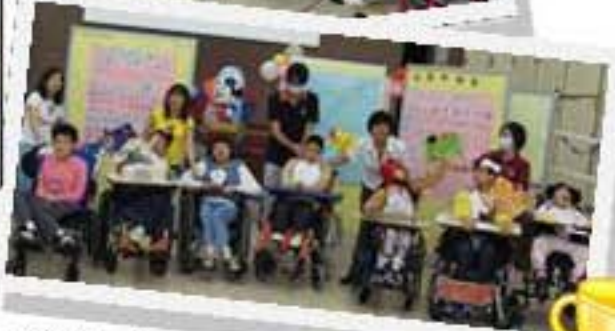
我們獲獎無數，成為大贏家！