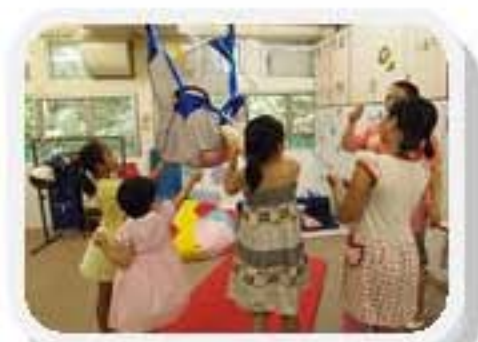
大家一起學習使用吊機

2009-2010 年度樂仁 Fan Club 為各位學生的兄弟姐妹安排了多元化的活動，希望可以增加兄弟姐妹對學生的了解及增進手足之情，就讓我們一起分享上年度的活動花絮！