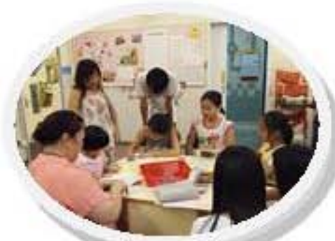
齊齊製作心意咁送給兄弟姐妹