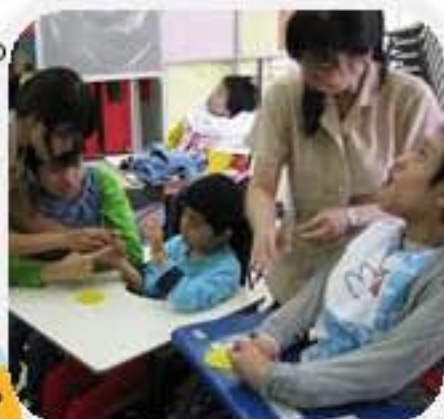
同學寫下新學年的目標和願望