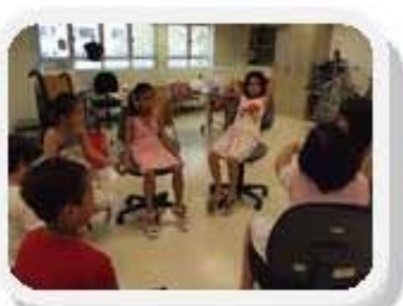
排排坐預備玩遊戲！