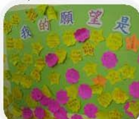
我們有很多願望呀！