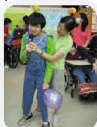
同學與大家分享她的目標