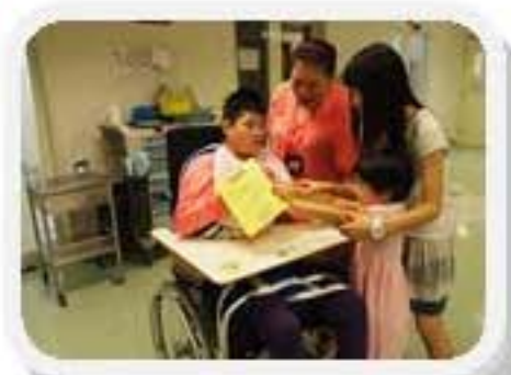
收到心意咁時很驚喜啊！