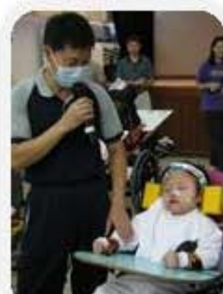
李老師介紹新同學讓大眾認識