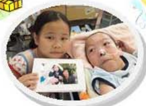
送贈心意咁的場面很溫馨呀！

新學年的樂仁 Fan Club 亦將有很多精彩的活動，包括：Fan Club 週末狂熱、興趣班及表演等。