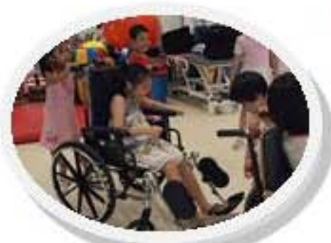
大家一起體驗使用輪椅