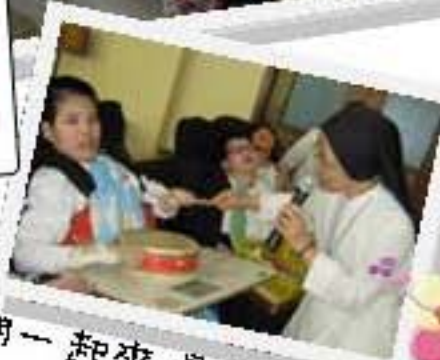
我們一起來唱詩讚美天主！